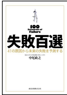
“100 Scenarios of Failure” Morikita Publishing